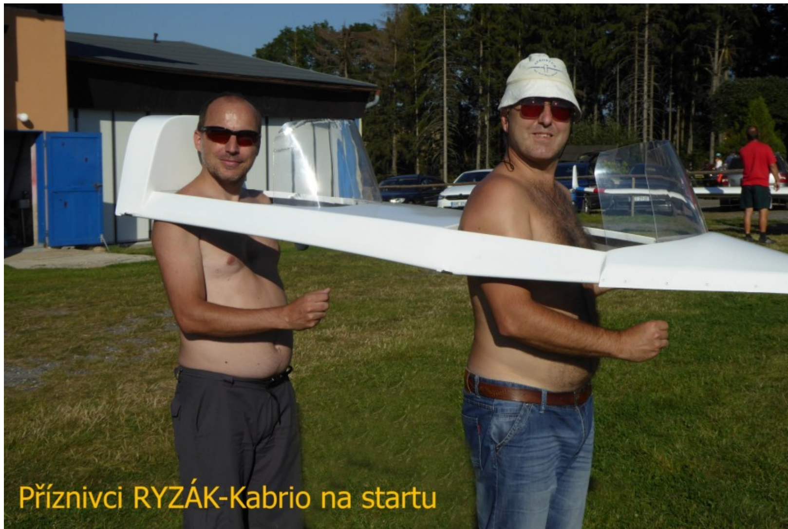
Priznivci RYZÁK-Kabrio na startu